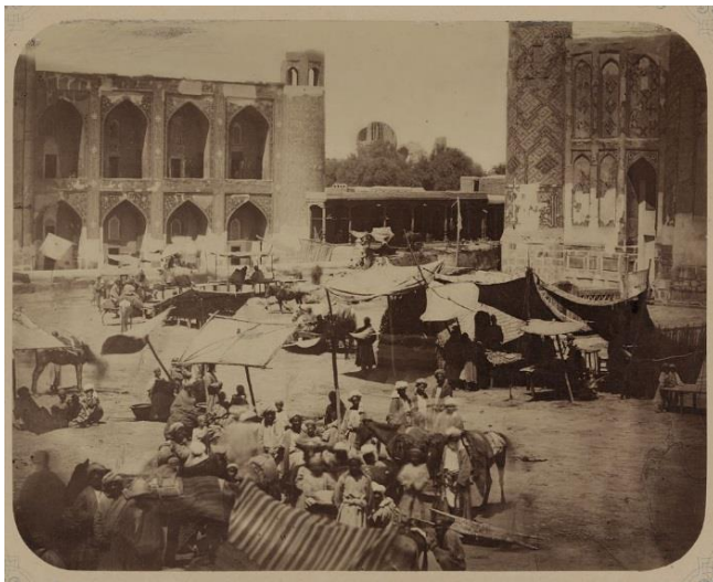
2-расм. Самарқанд. Регистон майдони