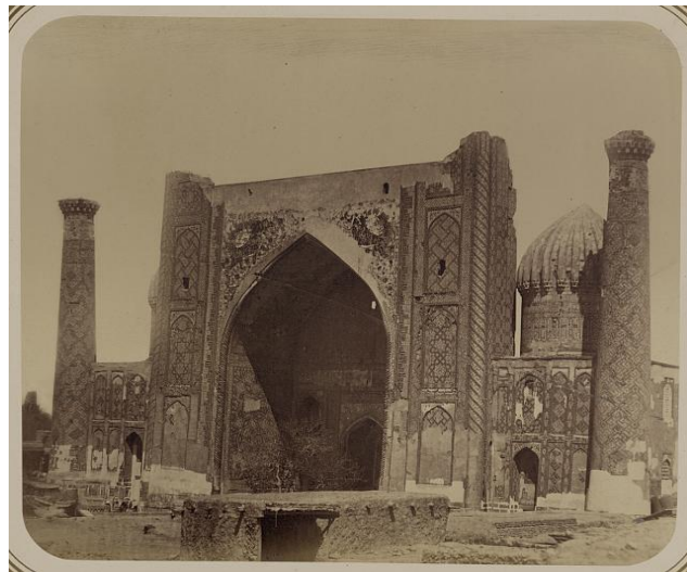
3-расм. Шердор мадрасаси

Шаҳрисабз XVIII—XIX асрларда мустақил бекликнинг маркази бўлган. XVIII аср охирида Бухоро амирлигига қўшилди. XIX асрда келиб шаҳар қайтадан беш дарвозали кўрғон девор билан ўраб чиқилди. Сўнги дарвоза Қалмоқ дарвоза деб номланган. Шаҳар тарҳи ҳозиргача, ўша даврдаги вазиятни сақлаб қолган. Асосий жамоат марказлари (маъмурий зона, меъмориал мажмуалар, бозор,) орасини турли катта-кичик кўчалар кесиб ўтган. Шаҳар аҳолиси гузарларда яшаган, қурилмалари зич бўлган. Шаҳар аҳолиси касби, уруғаймоғига кўра гузар жамоасини ташкил қилишган. Шаҳар организми архитектуравий бирликни ташкил қилиб қайтарилиувчан, «типик» унсурлардан иборат эди. Улардан шаҳар қиёфасини белгиловчи турар уйлар ва жамоат бинолари турли меъморий композициялар тuzилган. XIX асрнинг иккинчи ярмида шаҳарда 30 минг аҳоли истиқомат қилган. Унда тўрт