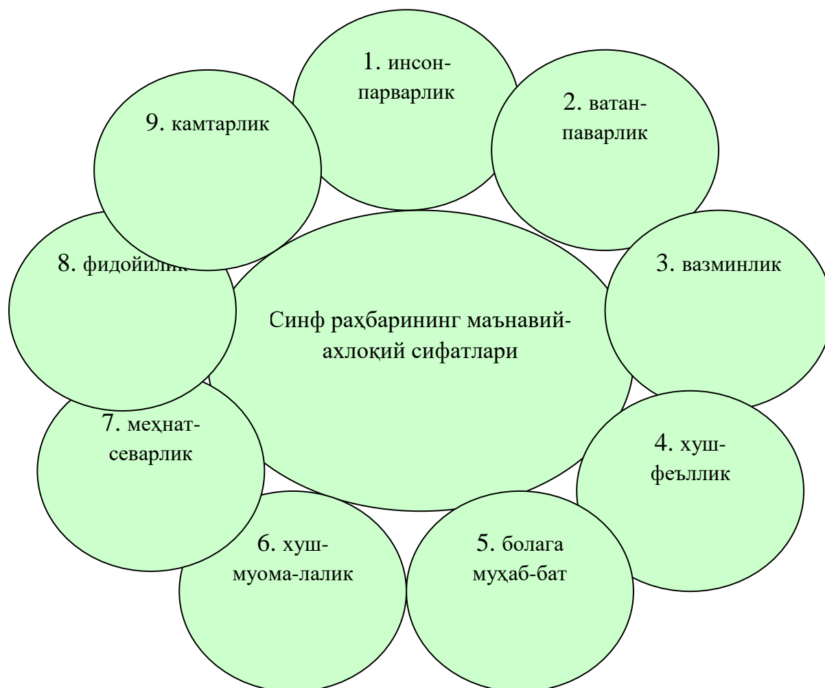
2-расм. “Нилуфар гули” график органайзерининг қўлланилиши. ХУЛОСА

Машғулотларда қўлланилган мазкур методлар асосида талабаларда фан юзасидан олган билим, кўникма, малакалари, ҳамда ижтимоий компетенциялар ва маънавий-ахлоқий сифатларнинг ривожланганлиги муҳим омил сифатида қаралди. Ушбу методиканинг самарадорлигини ишимизнинг кейинги қисмида математик-статистик таҳлиллар асосида аниқланган.