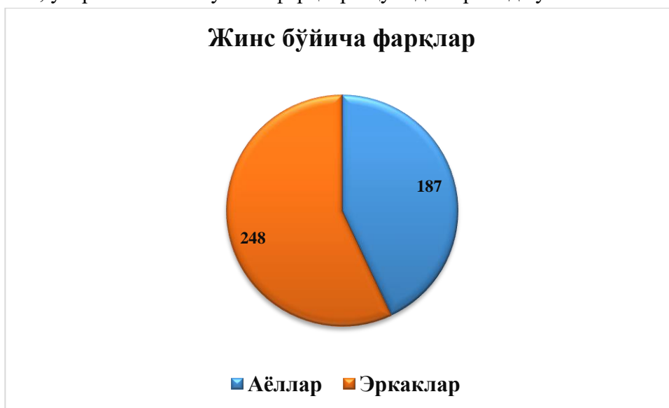
1.расм. Тадқиқот синалувчиларининг жинс тафовутлари.

Натижалар таҳлиliga кўра тадқиқотимизда жами 435 нафар синалувчи иштирок этган бўлиб, уларнинг жинс бўйича фарқлари қуйидаги расмда ўз аксини топган.