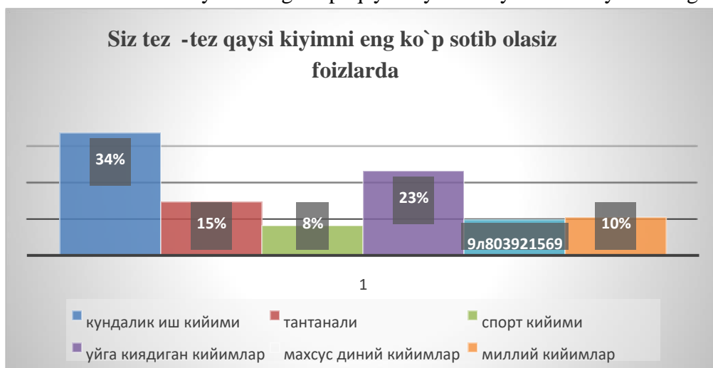
Yoshi katta ayollar eng ko‘p qaysi kiyimni kiyishlari bo‘yicha diagramma

Katta yoshdagi ayollarimiz asosan yosh o‘tishi sari qomatda o‘zgarish yani Ko‘krak aylanasi, bel aylanasi, bo‘ksa aylanasi o‘zgarishlar ko‘krak va qorinn qismidagi osilib qolishlar, bo‘ksa aylanasi kattalashib ketishini qomatda turli xil noparametrik o‘zgarishlarni kuzatishimiz mumkin. Shuning uchun katta yoshli ayollarimiz yelkali kiyimlarni qomatda qanday shakl(kiyim siluyeti) hosil qilishini tanlashda albatta Yoshi, o‘z qomat shaklidan, turidan kelib chiqib 22% to‘g‘ri, 35% sal yopishgan, 11% yopishgan, 30% trapettsiya, 2% ovval siluyetda kiyinishni maqul ko‘rishlari.