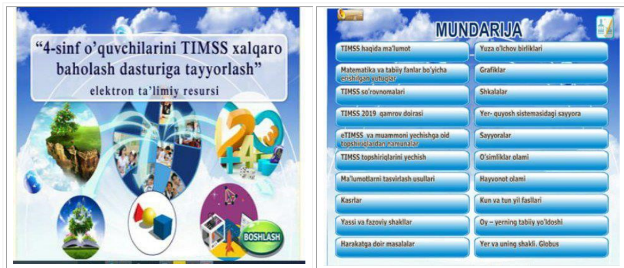
1.1-расм. 4-синф ўқувчиларини TIMSS халқаро баҳолаш дастурига тайёрлаш номли мултимедияли электрон ахборот ресурси

тафаккури, диққати хотираси, мулоҳаза қилиш қобилияти, олинган билимларини амалиётда қўллаш кўникмалари ҳамда математик тушунчалари ҳақидаги тасаввурлари ривожлантирилади. Бу ресурсимиздаги топшириқлар ўқувчиларни мустақил фикрлашга, изланиш, хулосалар чиқаришга ва ўқувчиларни математика ва табиатшунослик фанларига қизиқишларини оширади. Бу ресурс орқали ўқувчилар TIMSS халқаро баҳолаш тадқиқотларида қўлланилган топшириқларни ишлаб кўришадилар ва уларда бундай форматдаги топшириқларни ечишга бўлган кўникма ва малакалари шаклланади.