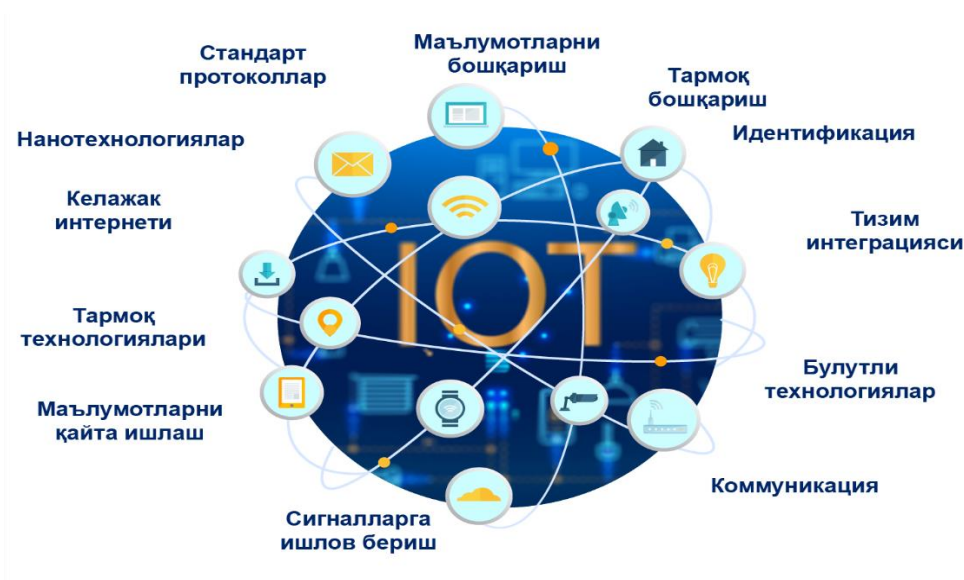
2- расм. Интернет ашёлари: Фойдаланиладиган технологиялар тўпламлари

Буюмлар интернет бу битта технология эмас, лекин у турли хил аппарат ва дастурий таъминотларнинг тўпламидир. IoT ахборот технологиялари интеграциясига асосланган ечимларни тақдим этади, бу маълумотлар ва алоқа воситалари учун ахборотлар сақлаш ва олиш учун ишлатиладиган аппарат ва дастурий таъминотни, шунингдек, шахслар ёки гуруҳлар ўртасидаги алоқа учун ишлатиладиган электрон тизимларни ўз ичига олади.